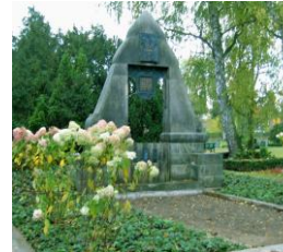
Grab Familie Wickel