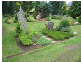
Sarggräber mit langer Pflanzfläche

Für seelsorgerische Gespräche erreichen Sie Pastorin Günther unter 0176-229 763 93 oder unter pn.guenther@kirche-trittau.de