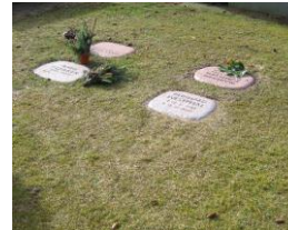
Gräber mit Kissensteinen