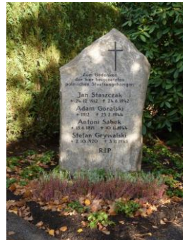
Gedenkstein für Zwangsarbeiter