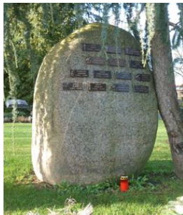
Urnengräber mit Plakette