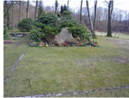
Urnefeld für anonyme Beisetzungen