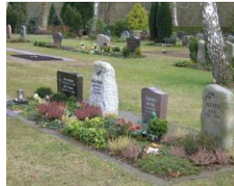
Sarggräber mit kurzer Pflanzfläche